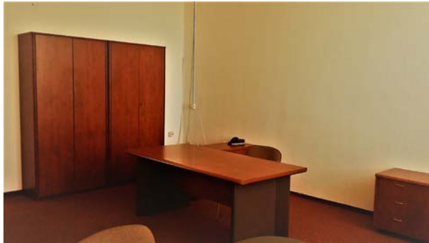
Biroul nr. 1123